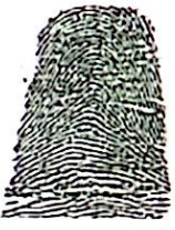
IMPORTE DE PEDIDO

FECHA DE NACIMIENTO 22-MAY-2002 LA VICTORIA (VALLE) LUGAR DE NACIMIENTO 1.80 O+ M ESTATURA G.S. RH SEXO 18-JUN-2020 LA VICTORIA FECHA Y LUGAR DE EXPEDICIÓN